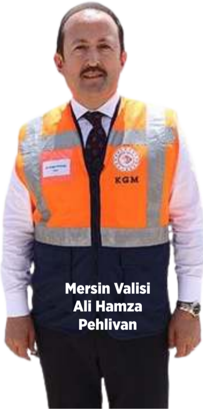
Mersin Valisi Ali Hamza Pehlivan

Bütün bu açıklamaların ardından, Osmaniye ile Alanya arasındaki yol, yapılan iyileştirmeler sayesinde normal seyirle 10 saate alınan mesafe 6 saate düşerek önemli bir zaman tasarrufu da sağladı. Bu geliştirmeler, bölgedeki ulaşım ağının modernizasyonu ve yolculuk konforunun artırılmasında büyük rol oynadı.