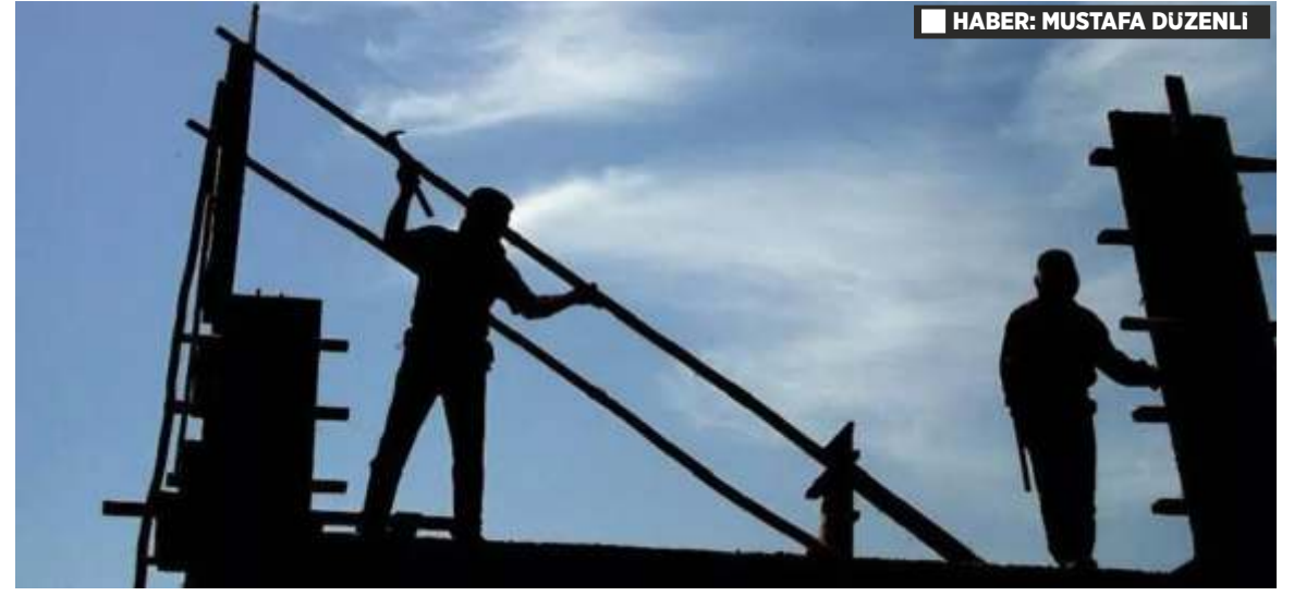
HABER: MUSTAFA DÜZENLİ

üzerindeki olumsuz etkileri artıyor. Yetkililerin bir an önce gerekli önlemleri alması ve yönetmeliklere uygun hareket edilmesini sağlaması gerekiyor. Vatandaşlar ise bir an önce huzurlu bir yaşam alanına kavuşmayı umut ediyor.