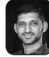
Ruşdi Ribhi es-Serrac