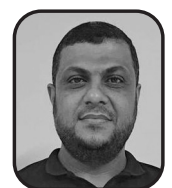
Assam M. Bihar