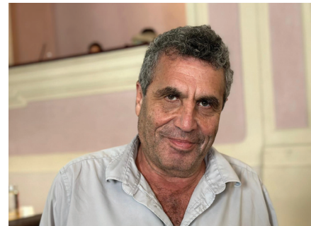
İsraili Gazeteci, +972 Magazin Editörü Meron Rapoport: "Bir İsraili olarak kendimi sorumlu hissediyorum"

zorlaştırıyor. Eskiden barış için bastırabilecek bazı İsraili rasyonalistlerin ve İsraili bilge insanların olabileceğini düşünürdük. Ancak artık İsraililer üzerinde uluslararası ciddi bir baskı olmadan, çözüm için Rusya'ya uygulananlara benzer uluslararası yaptırımlar olmadan bir çözüm olamayacağı sonucuna vardık. Uluslararası baskı olmadığı takdirde çözüm yok!