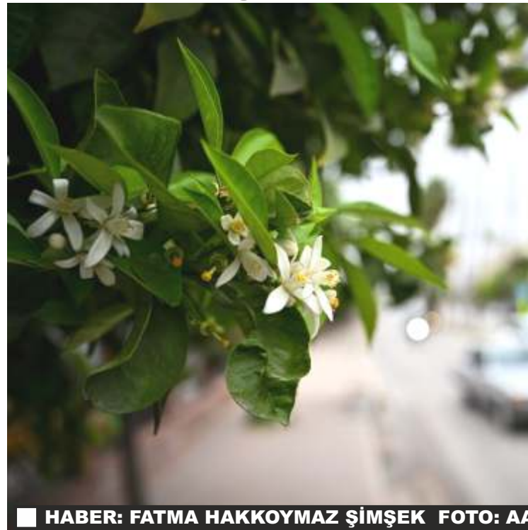
HABER: FATMA HAKKOYMAZ ŞİMŞEK

Adana Valisi Yavuz Selim Köşger , karnavalın kente büyük bir hareketlilik