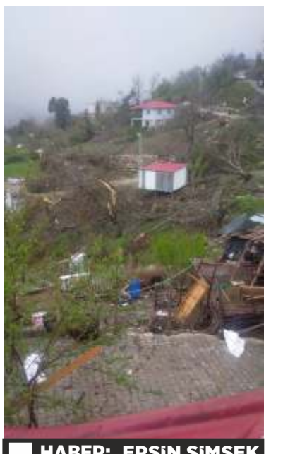
HABER: ERSİN ŞİMŞEK

Bölge sakinleri, iklim değişikliğiyle birlikte hortum ve benzeri hava olaylarının sıklığına belirterek, yetkililerden erken uyarı sistemleri ve dayanıklı altyapı çalışmalarını talep etti.