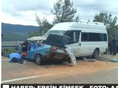
HABER: ERSİN ŞİMŞEK

Jandarma ekipleri, kazanın meydana geliş sebebini belirlemek için olay yerinde incelemelerini sürdürüyor.