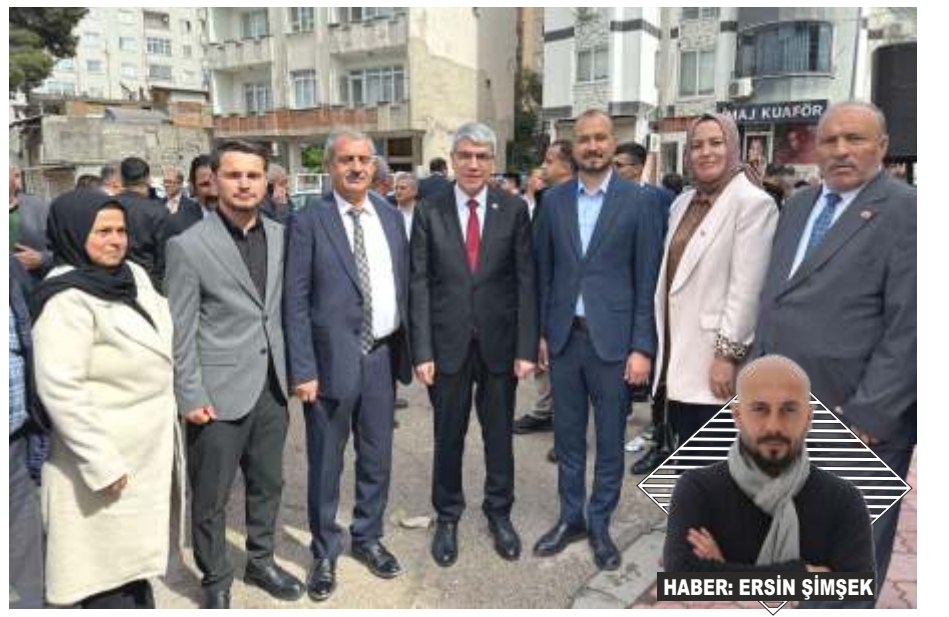
HABER: ERSİN ŞİMŞEK

Başkan Uytamaz, Toprakkale'nin gelişimi ve halkın refahı için gece gündüz demeden çalıştıklarını belirterek, şehrin geleceği adına yatırımların devam edeceğini vurguladı. Eğitimden altyapıya, sosyal projelerden kültürel etkinliklere kadar geniş bir yelpazede çalışmalarına devam eden belediye, Toprakkale'yi daha modern, yaşanabilir ve güçlü bir şehir haline getirme yolunda emin adımlarla ilerliyor.