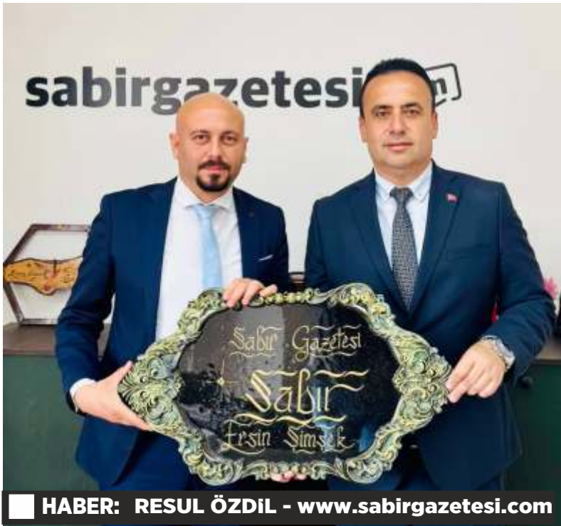
HABER: RESUL ÖZDİL - www.sabirgazetesi.com