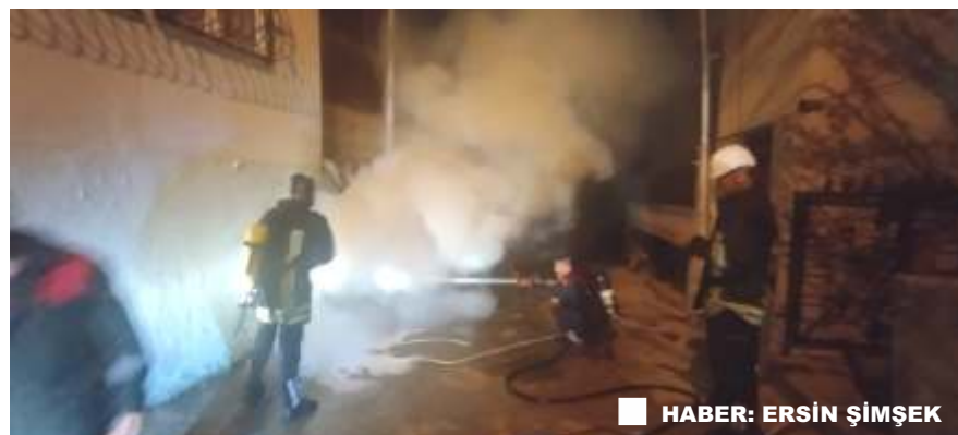
HABER: ERSİN ŞİMŞEK

Olayla ilgili soruşturma sürerken, mahalle sakinleri büyük bir korku yaşadı.